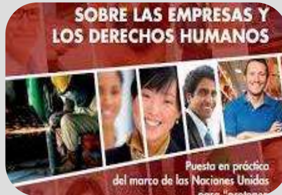
Principios Rectores sobre empresas y derechos humanos: puesta en marcha del marco de las Naciones Unidas para proteger, respetar y remediar (2011)