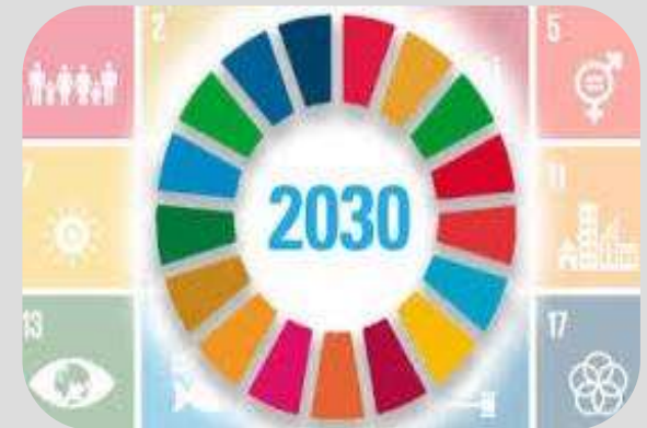
Agenda 2030 para el Desarrollo Sostenible (2015)